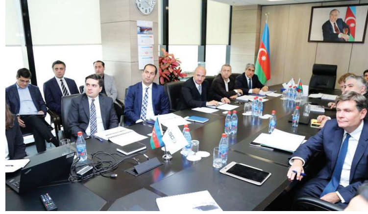
həyata keçirilir. Qeyd edək ki, hazırda ASCO-nun beynəlxalq sularında 14 gəmisi üzür. Azərbaycan bayrağı altında istismar olunan bu gəmilərdən 12-si quru yük gəmisi, ikisi tankerdir.

Nazirlər Kabineti “Magistratura təhsilinin məzmunu, təşkili və “magistr” dərəcələrinin verilməsi Qaydaları”nda dəyişiklik edib.