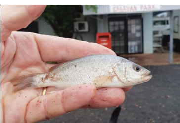
Avstraliyanın Yova şəhərinin sakinləri leysan yağışdan sonra əmələ gəlmiş gölməçələrdə balıqların üzdiyünü aşkar ediblər.

Mütəxəssislərin bildirdiyinə görə, balıq yağışı Avstraliya üçün heç də qeyri-adi hal deyil. Belə yağışlar azı ildə bir dəfə güclü qasırğa zamanı müşahidə edilir.