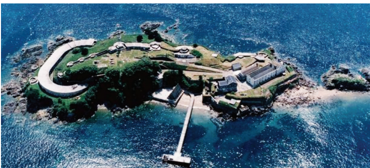
Böyük Britaniyanın Dreyk Adası 30 ildən sonra yenidən ictimaiyyəyə açılacaq. Adanın adı 1577-ci ildən dünya səyahətinə çıxmış admiral Frensis Dreykin adı ilə bağlıdır.

Adaya ilk tur martın 15-də təşkil olunacaq.