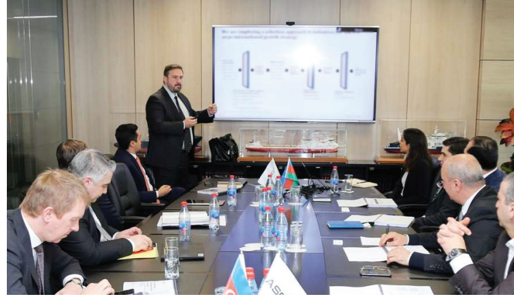
Planın hazırlanması Azərbaycan Xəzər Dəniz Gəmiçiliyinin çoxillik təcrübəsinə əsaslanaraq ASCO-nun əməkdaşlarının iştirakı ilə

Müzakirələrdə bildirilib ki, növbəti 10 il əhatə edən strateji inkişaf planında ASCO-nun yeni bazarlara daxil olma imkanları barədə geniş təhlil yer alıb. Bu planın həyata keçirilməsi ilə şirkətin Xəzər dənizi, Xəzər dənizə çıxan mövqeyi daha da güclənəcək.